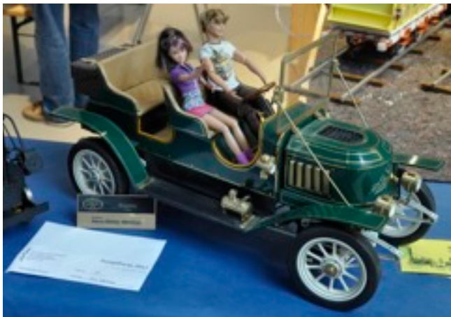
Stanly Steam Car