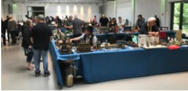
Die Ausstellungshalle füllt sich mit Besuchern...