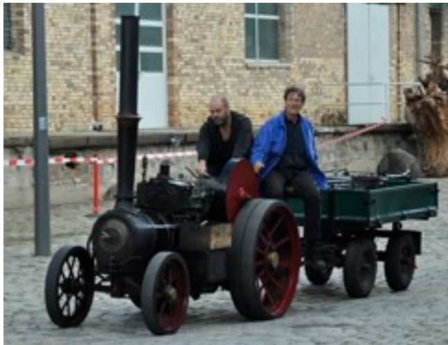
BURRELL Traktor im Maßstab 1:2

Damit dieser Teil unserer Technikgeschichte nicht in Vergessenheit gerät hat sich der Arbeitskreis Dampf zum Ziel gesetzt, mit der „Dampfparty“ auf verständliche Weise diese eindrucksvolle Technik noch einmal lebendig werden zu lassen.