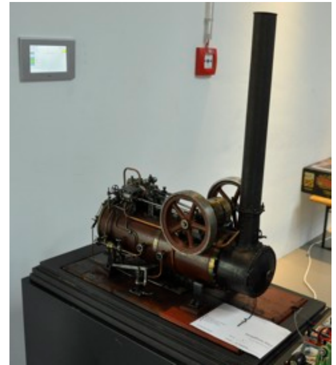
Lokomobil aus dem Museumsfundus