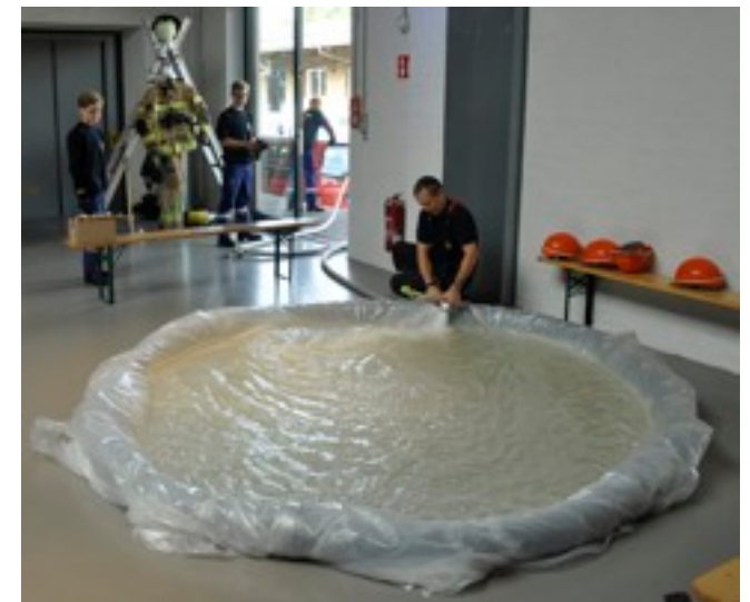
Ein Teich für Knatterboote